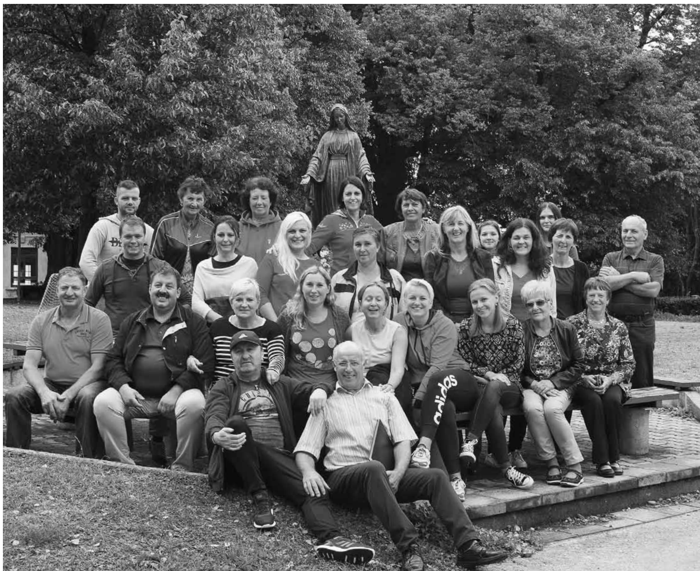
Letos smo pevci prvič izvedli intenzivne vaje, ki so potekale 25. in 26. avgusta v Domu duhovnosti Kančevci.