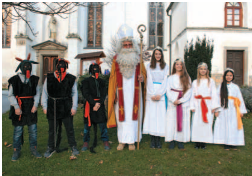
Sveti Miklavž v Juršincih

Kaj nas čaka za prazničnimi vrati, ko bo novo leto razigrano prestopilo prag? Bo jutro s soncem obsijano, bo z mehkim perjem udobno nam postlano, bodo novi zlati časi? Zlati in prijetni bodo! še sivino našo sami pozlatimo s poštenim delom in z dobroto, ji s smehom vdihnemo lepoto in s prijateljstvom iskrenim nežnost, srečo, mir, toplino.