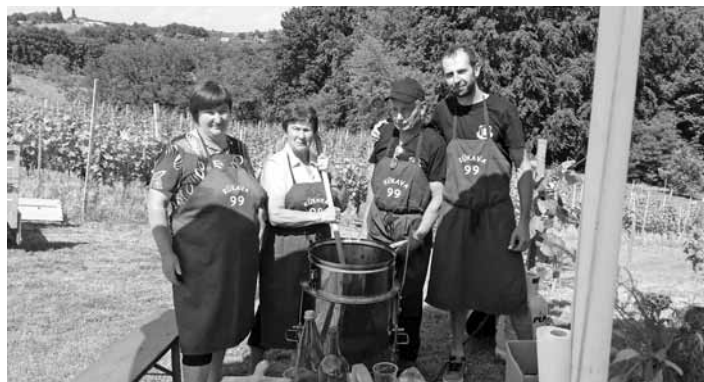
Zmagovalna ekipa Kükava 99

Na čistilni akciji so (tako kot vsako leto) sodelovali tudi osnovnošolci.