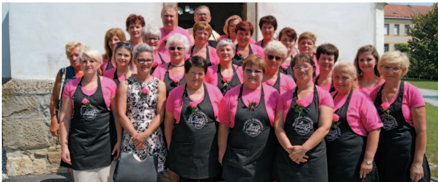
Članice in člani Društva gospodinj Juršinci na 23. prazniku gospodinj Juršinci.