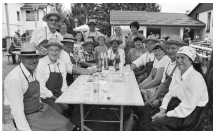
Pesničarji pri Svetem Duhu