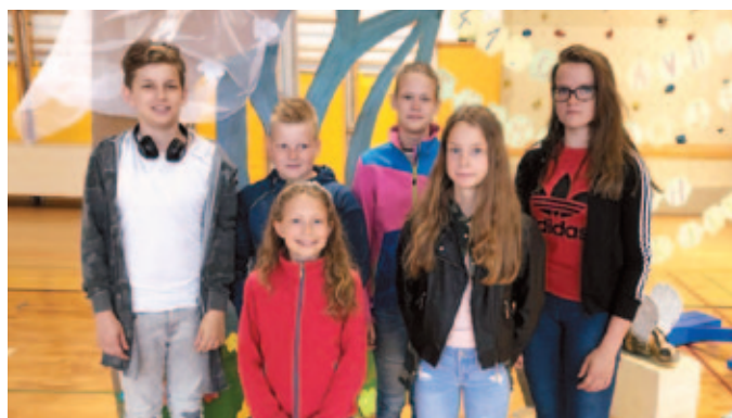
Zlato priznanje na državnem tekmovanju mladih čebelarjev Slovenije

Vsem občankam in občanom čestitamo ob občinskem prazniku.