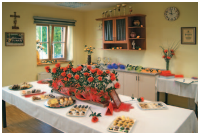
23. praznik Društva gospodinj Juršinci in otvoritev kuhinje v novih prostorih društva