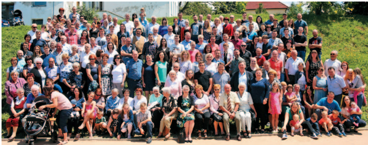
Srečalo se je 250 potomcev rodbine Slodnjak.

TERME DOBRNA HOTELS, SPA & MEDICAL CENTRE SINCE 1403