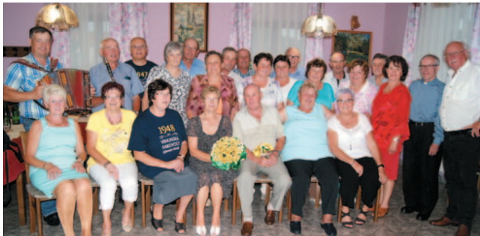
8.6.2018 so se zbrali sošolci, rojeni leta 1948 na že četrtem srečanju.