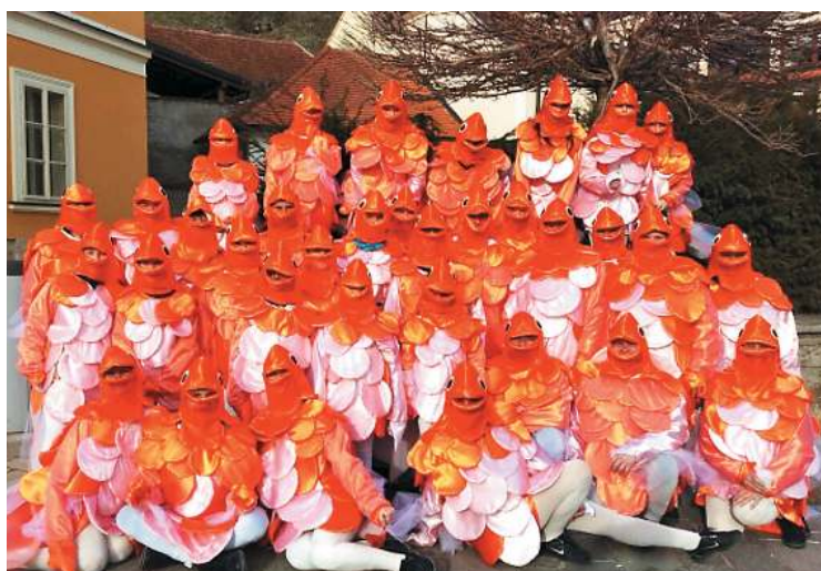
Juršinske zlate ribice ...