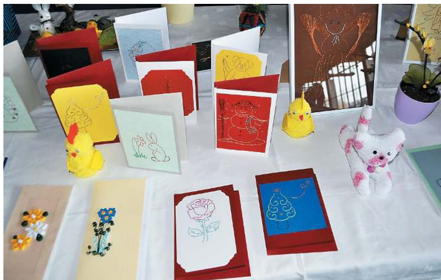
Nekaj utrinkov iz razstav ročnih del Kulturnega društva Hlaponci ...

Na vrtu cvet, na veji ptica, na mizi praznična potica. Veselo poje aleluja!