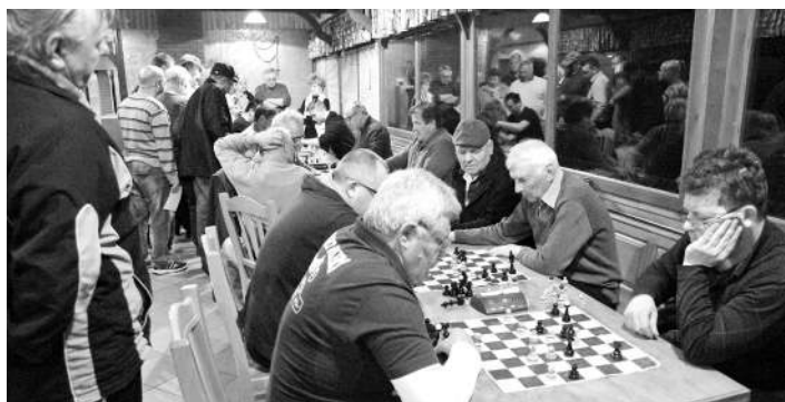
Utrinki z zaključnega hitropoteznega šahovskega turnirja pri Amurju v Bodkovcih.