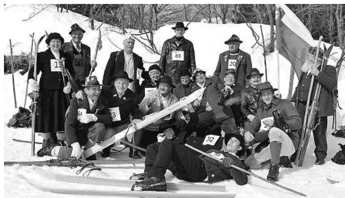
Slovenskogoriški smučarji v skupini ostalih smučarjev po starem pozimi 2015/2016 na Voglu.

Tako smo v zimi 2015/2016 že sodelovali na prvem tekmovanju v smučanju po starem, ki so ga organizirali »Veseli Savinjščani« na Golteh nad Mozirjem. Prireditelji in ostale slovenske skupine smučarjev po starem so bili zelo veseli, da se je pojavila še ena nova skupina. Preden smo se prav spoznali, smo jim morali večkrat razložiti, da nismo iz Prekmurja/Goriškega, ampak iz Slovenskih goric. In nekako smo jim le dopovedali, kje so Slovenske gorice in koliko je visoka naša najvišja gora, po kateri smučamo. Povedali smo jim, da je to Gomila s 352 metri. Potem je sledilo že novo vabilo na smučanje po starem na Voglu. Tudi tega smo se udeležili.