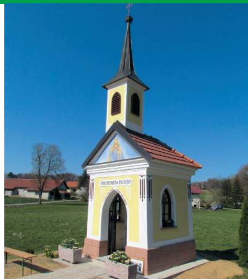
Obnovljena kapela v zagorcih.