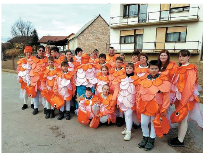
...na pustni povorki v Dobovi.