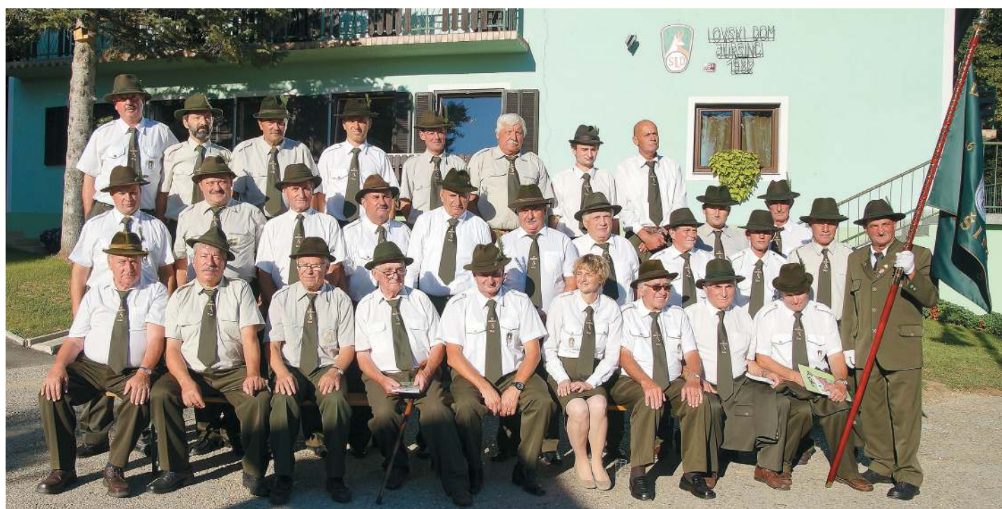
Skupinska fotografija ob 70. letnici LD Juršinci.