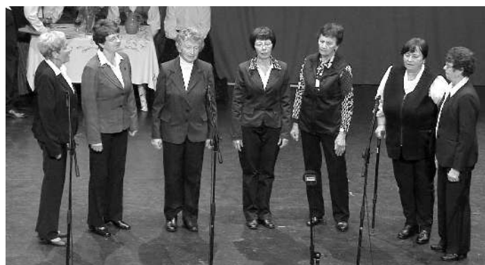
... in na koncertu v Majšperku.