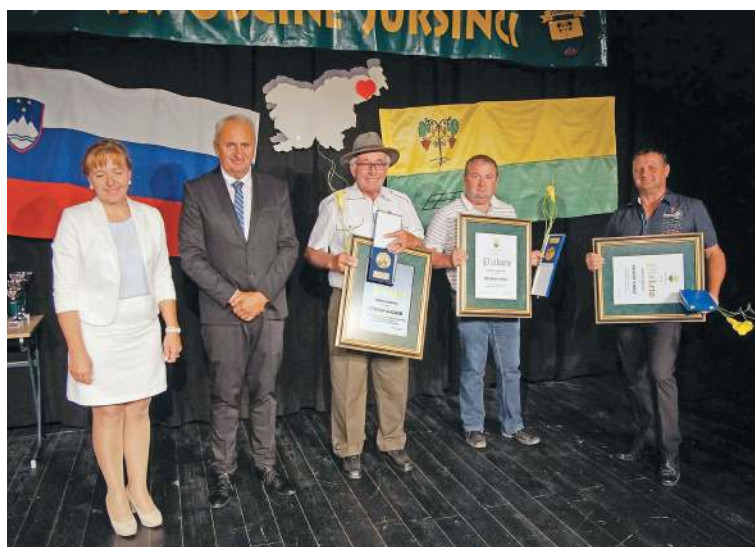
Prejemniki plaket in priznanj ob 22. prazniku Občine Juršinci