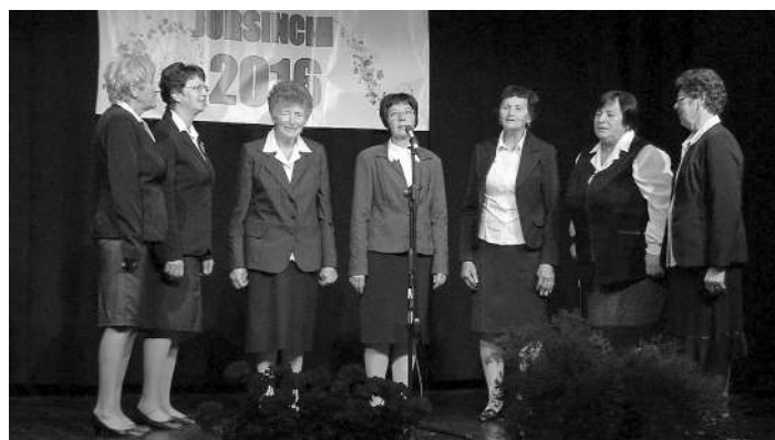
Ljudske pevke KUD dr. Antona Slodnjaka Juršinci pred domačim občinstvom ...