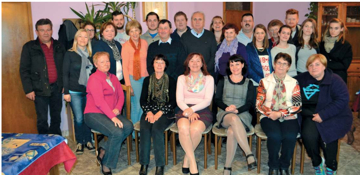
Redni občni zbor KUD dr. Antona Slodnjaka Juršinci