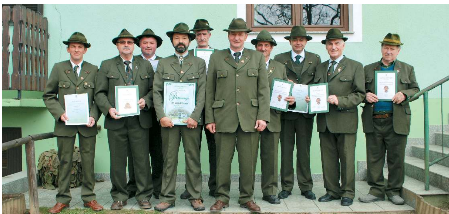
Dobitniki Priznanj in jubilejnih znakov na rednem letnem občnem zboru LD Juršinci, ki je že 69. po vrsti