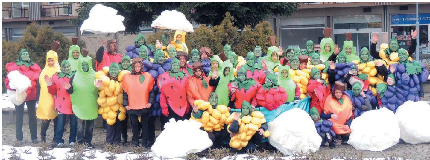
Juršinske "SADNE KUPE" v izvedbi KED Juršinci

Zarja velikonočnega jutra naj nas vedno znova napolnjuje z upanjem, da je življenje močnejše od smrti, močnejša od sovraštva. To upanje naj nam daje smisel in pogum, da bomo z vedrim pogledom zrl v prihodnost.