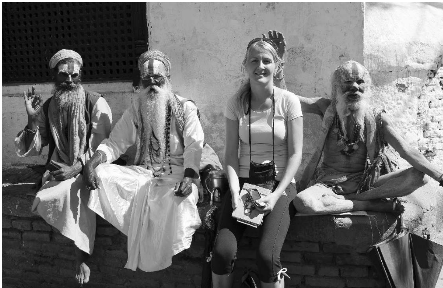
Sadu – »dober človek«. Saduji se odreka materialnim dobrinam in spolnemu življenju.

Želja po potovanju v dežele Azije je tlela že kar nekaj časa in končno sem se le odločila, da grem. Po premišljevanju, katero državo izbrati, pa je le padla odločitev – Nepal, Tibet in Peking. Na potovanju sem bila oktobra, kar je bilo ravno v času moje »tridesetke«.