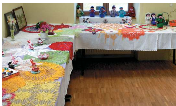
3. Velikonočna razstava izdelkov članic društva gospodinje Marta iz Juršincev.