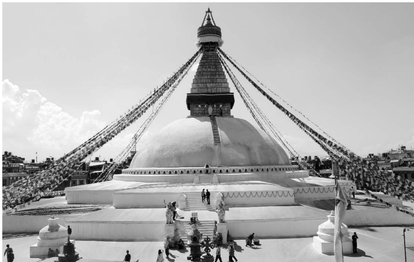
Boudhanath, ena od največjih stup na svetu. Oblika naj bi uprizarjala Budo v sedečem molitvenem položaju.