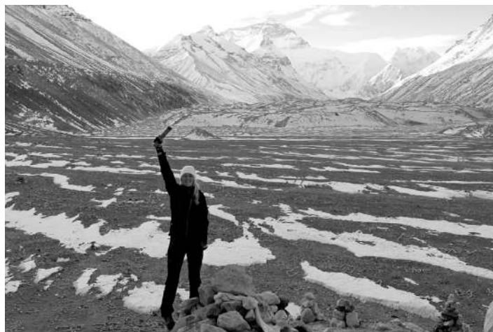
Pod Mount Everestom, najvišji gori na Zemlji (vrh v ozadju), v Nepalu znana pod imenom Sagarmatha (»čelo neba«), v Tibetu kot Čomolungma (»mati vesolja«).

Počasi se je naše potovanje bližalo koncu in ostal nam je še let do